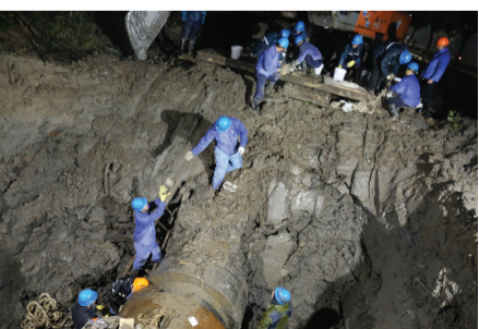
春节前夕，滨海供水公司抢修人员在寒夜中冒雨抢修DN1000一期原水管，连续工作12小时，至晚上9点抢修完成。