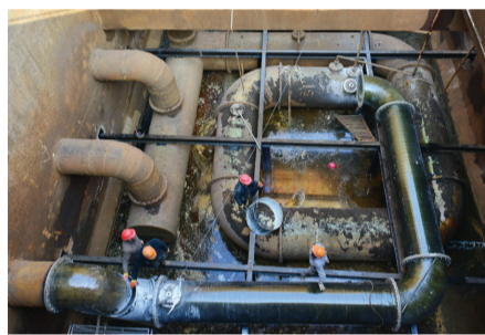
为提升三期工业废水芬顿工艺备用处理量，绍兴水处理公司员工实施气浮吸水井进水管及加药管道改造。