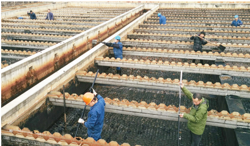
春节期间，由于排污企业停产放假，入网工业废水量大幅下降，江滨水处理公司抓紧时机对生化池进行清理冲刷，以提高沉淀效果。