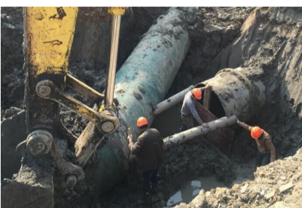
为配合香林大道建设，小舜江供水二期总管木屐桥段DN1400倒虹管需移位改造。1月20日（十二月廿三）9点起，柯桥供水公司日夜奋战，历时48小时顺利完成兜口。