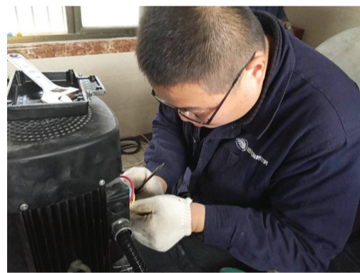
2月1日，农历大年初五晚上，瓜渚绿洲住宅小区发生停水，柯桥供水公司二次供水维修人员迅速赶赴现场，经过三个小时抢修，到次日凌晨1点恢复了该小区供水。