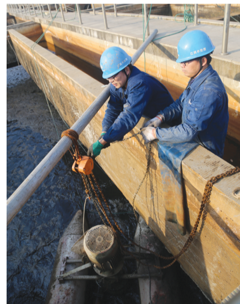
江滨水处理公司维修人员通过浮筒泵开展一体化生物池清池。