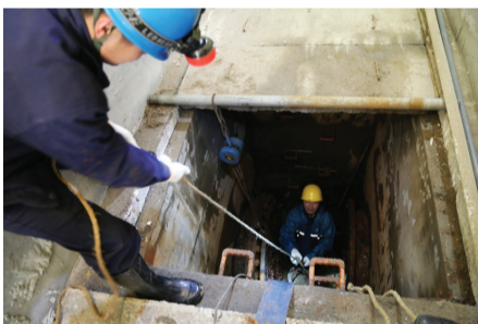
滨海供水公司员工对三期清水池进行全面清洗及检修，确保出水水质。