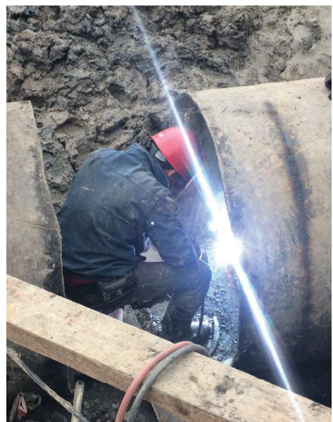
恒通水务建设公司员工实施福全至柯东DN1200新老管线迁建兜口。