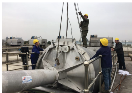
绍兴水处理公司员工开展二期德流池试验格栅安装，以减少后续工艺段中杂物造成的泵机堵塞。

编者按： 新春佳节，对于大多数人来说是阖家团圆、走亲访友的美好时光，可是对于水务人来说，春节意味着设备设施维修改造的繁忙，意味着管线兜口作业的争分夺秒，意味着应急抢修服务的24小时值守……即便如此，水务人依然面带微笑，坚守在各自的工作岗位上，成为一支守卫全区供排水的铁军。